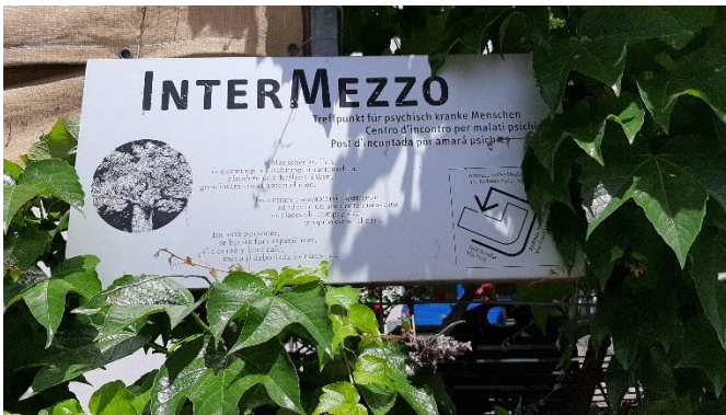
Tagestreff und Tagesstätte Bruneck